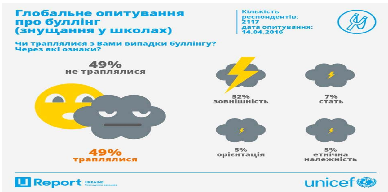
Рис. 1. Жертви булінгу за ознаками (складено згідно звіту ЮНІСЕФ)

За даними U-Report, 49 % респондентів підтвердили, що вони піддавалися булінгу, а саме через: зовнішність, стать, орієнтацію, етнічну належність (рис. 1) [2].