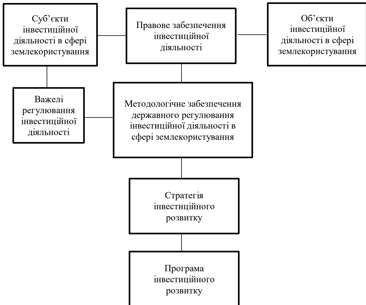
Рис. 3. Організаційна схема державного регулювання інвестиційної діяльності в сфері землекористування

Наведемо організаційну схему державного регулювання інвестиційної діяльності в сфері землекористування.