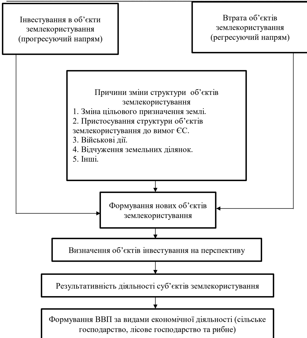
Рис. 4. Методологічні засади формування ВВП за видами економічної діяльності (сільське господарство, лісове господарство та рибне)

Таким чином, реалізація запропонованих методологічних засад формування ВВП в сфері землекористування дасть можливість збільшити обсяги залучення інвестицій та забезпечити їх оптимальний розподіл.